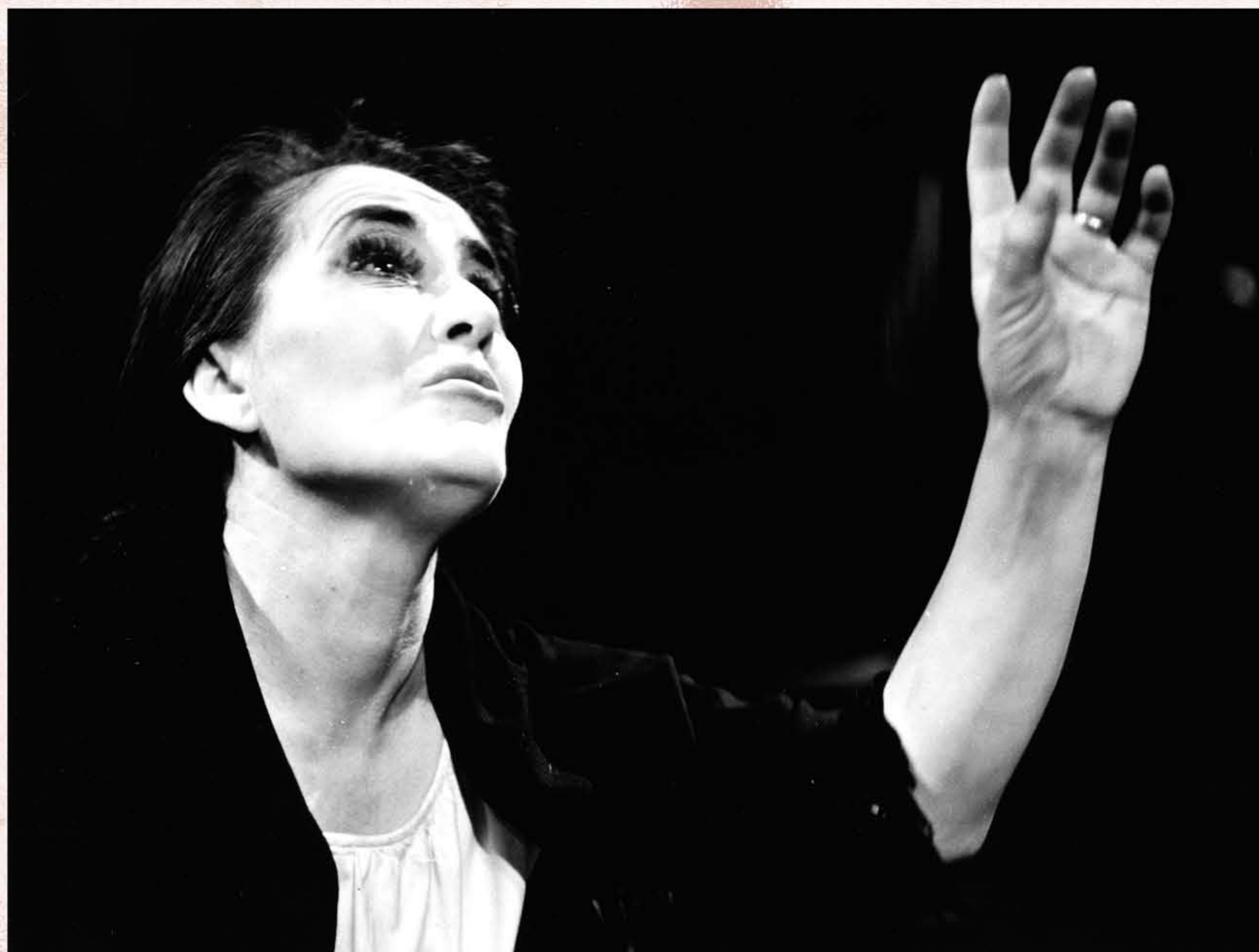
JENŮFA (Janáček, Jej pastorkyňa, 1966)