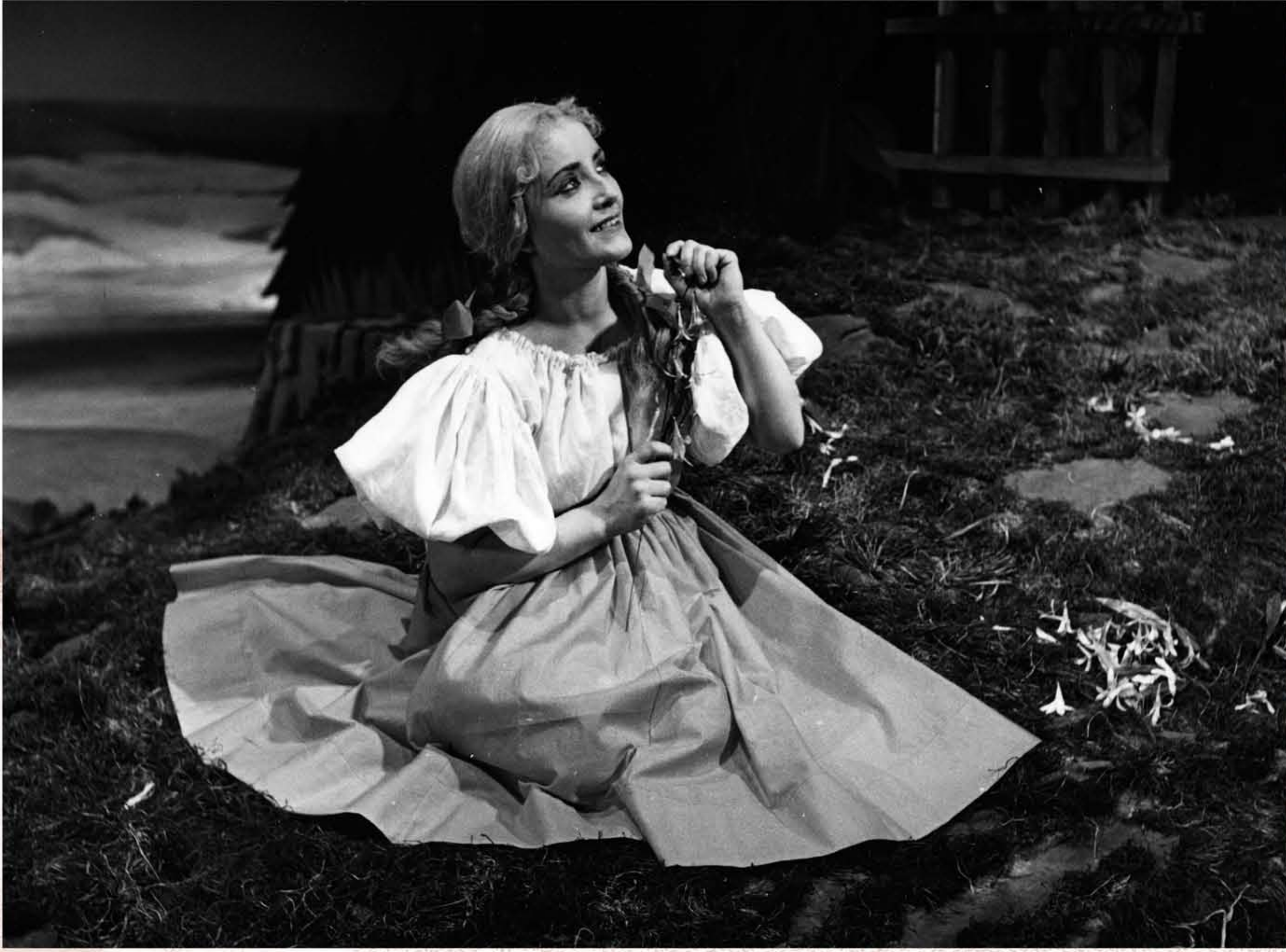
BARČA (Smetana, Hubička, 1952)