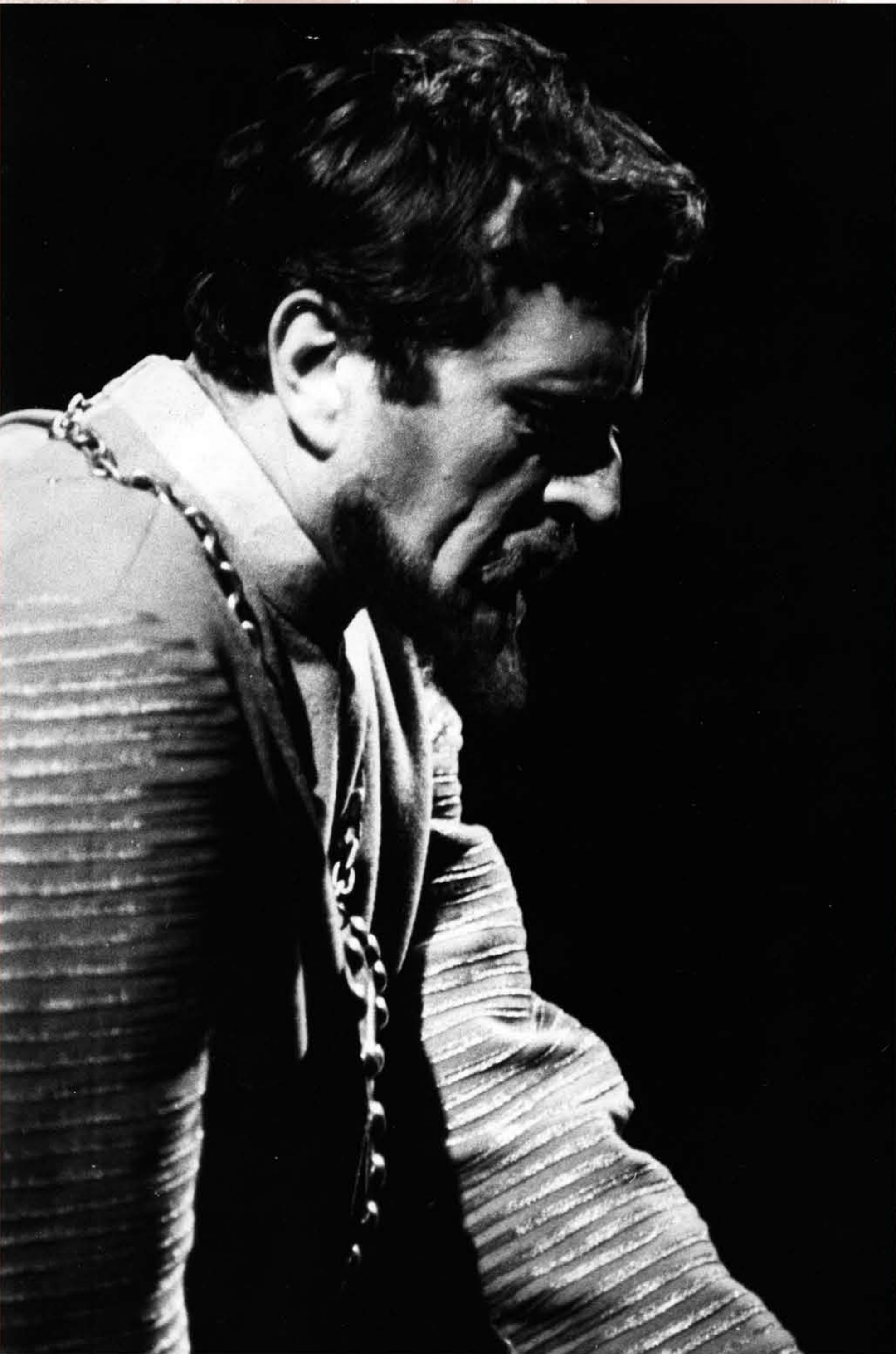
IGOR (Borodin, Knieža Igor, 1962)