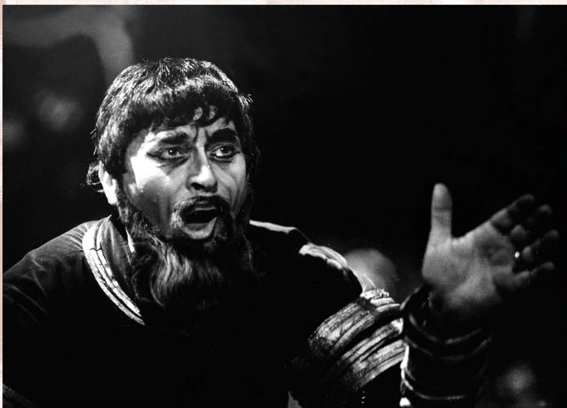
NABUCCO (Verdi, Nabucco, 1966)