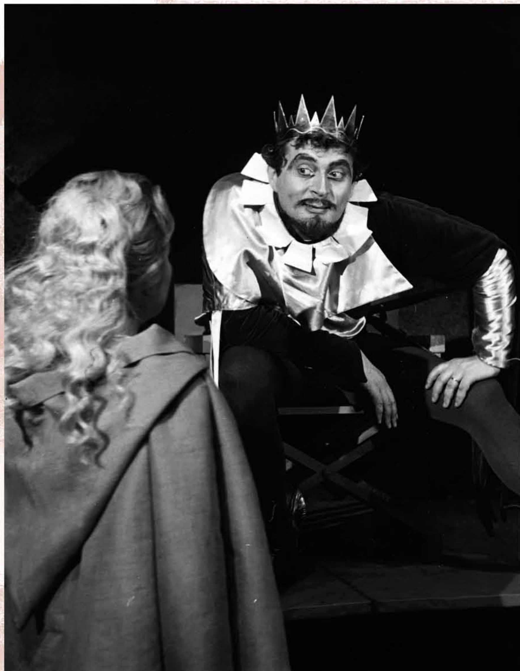
KRÁĽ (Orff, Múdra žena, 1961)