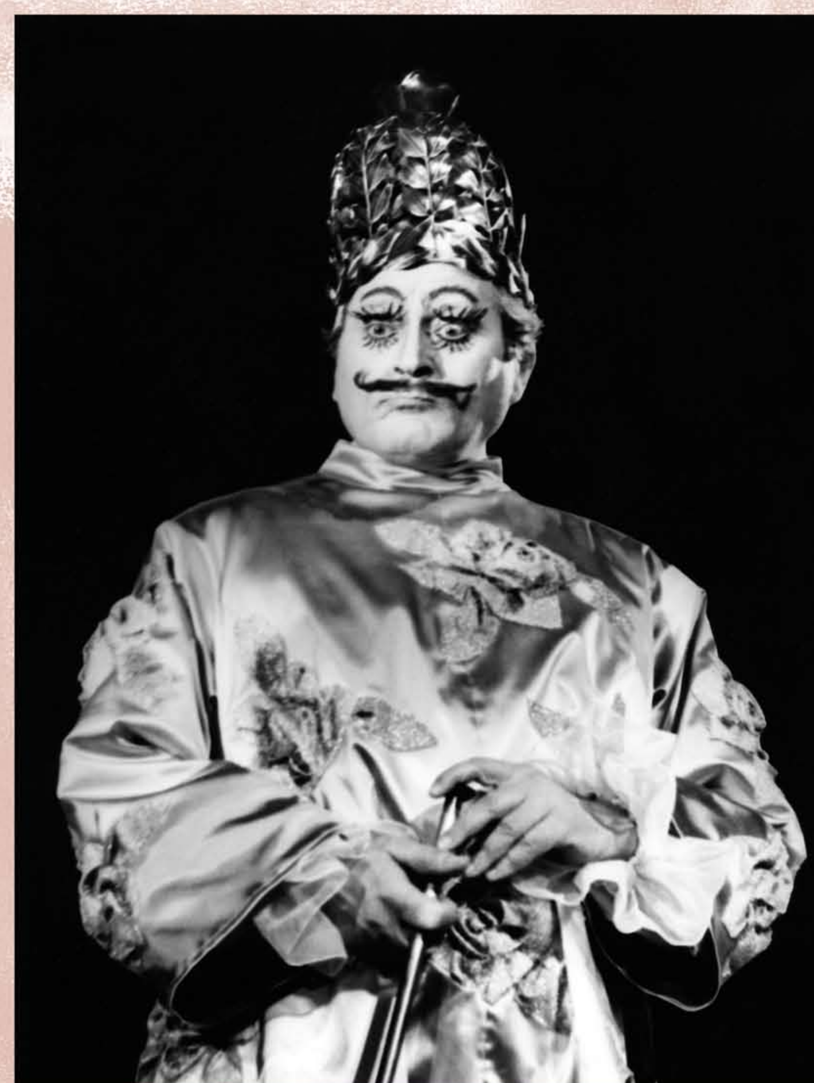
CISÁR (Beneš, Cisárove nové šaty, 1969)