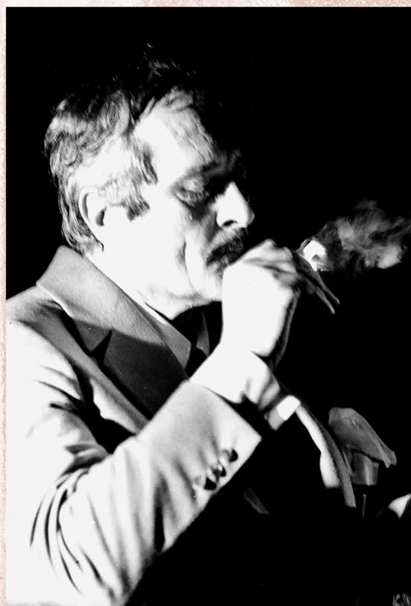
ALONSO (Hazon, Sobášna kancelária, 1975)