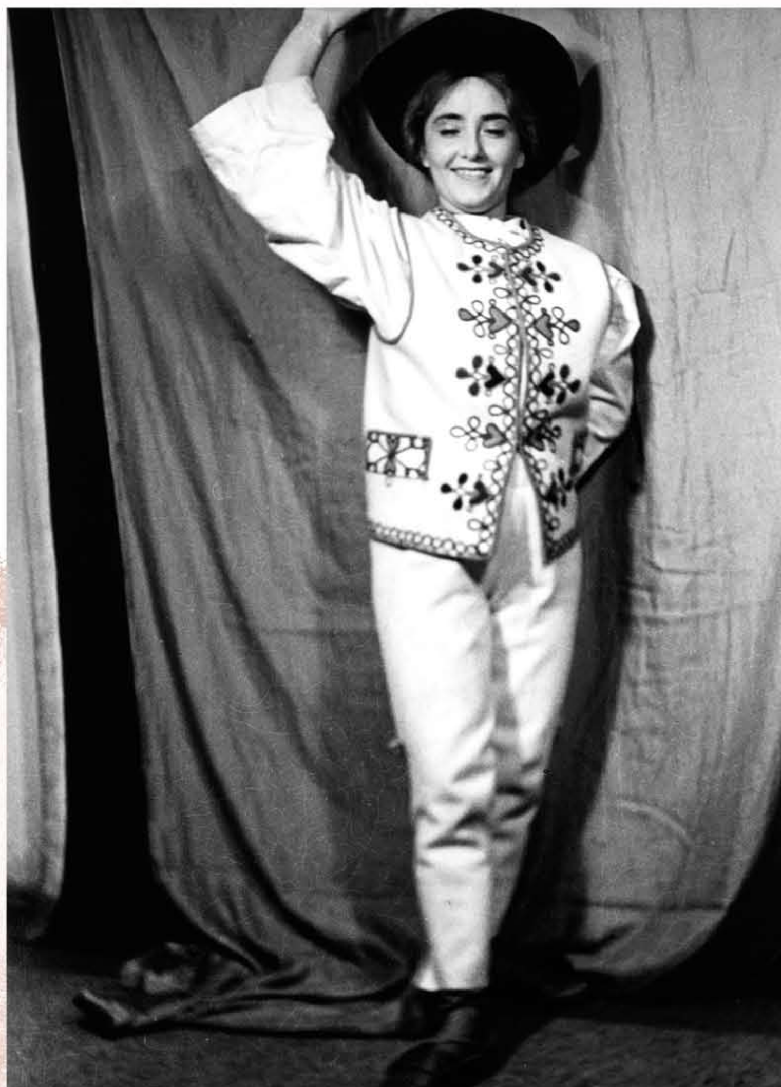
PASTIERIK (Suchoň, Krútnava, 1952)