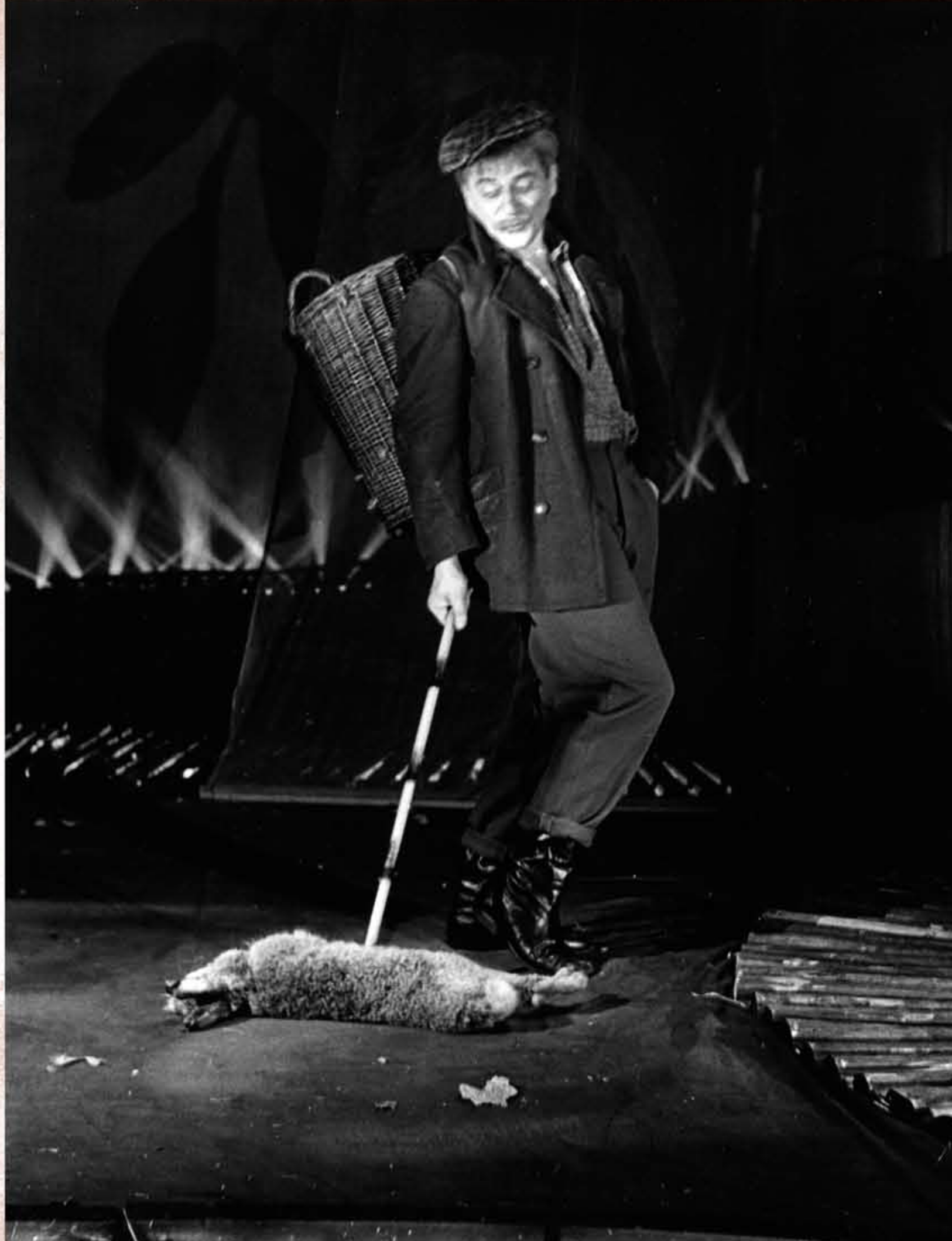
HARAŠTA (Janáček, Líška Bystrouška, 1958)