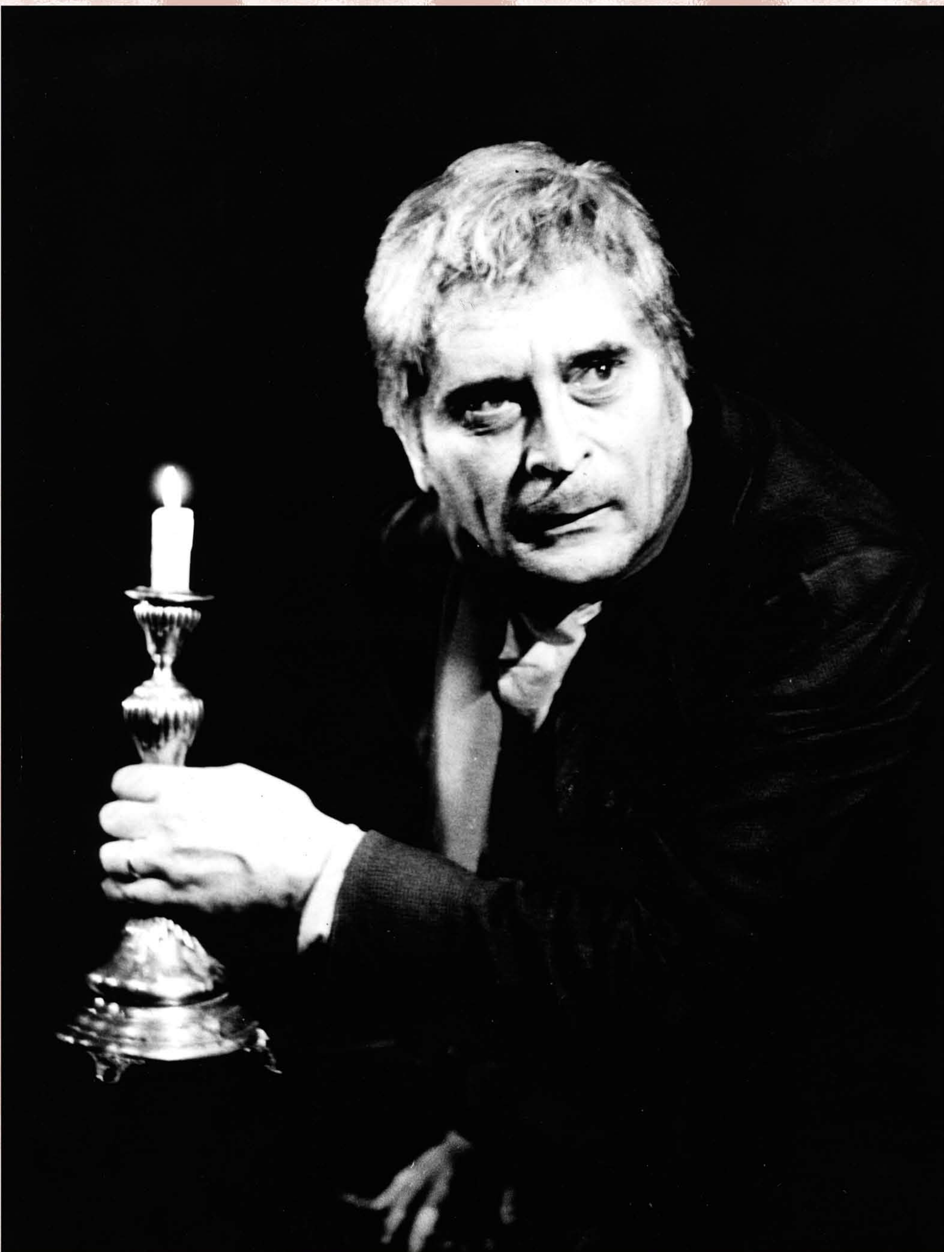
DAVID SCROOGE (Cikker, Mister Scrooge, 1963)