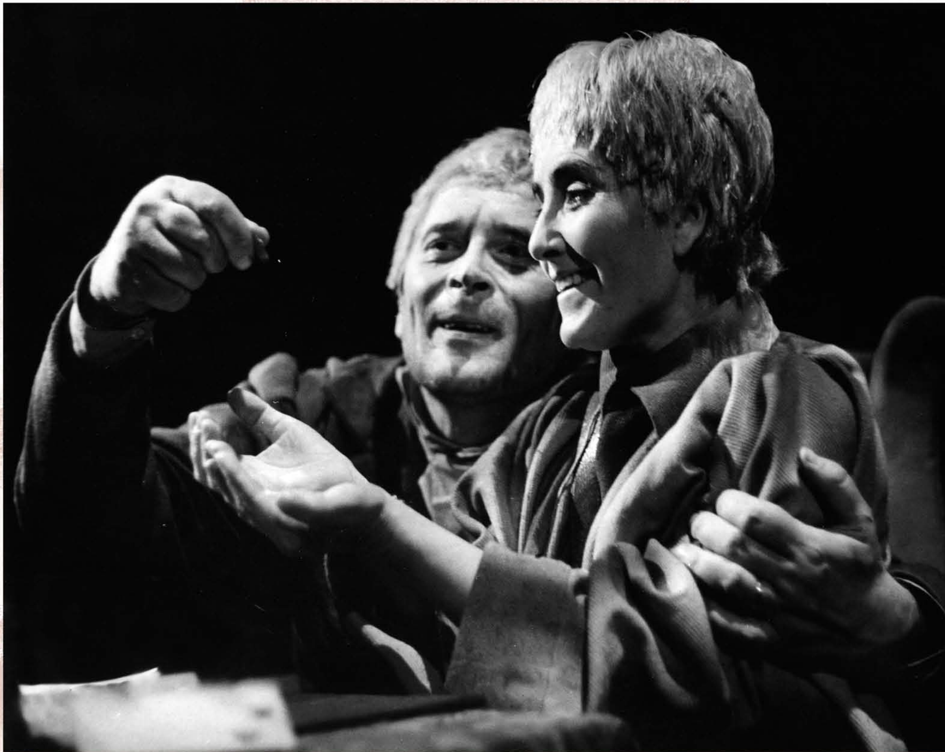
DAVID SCROOGE A KOLEDNÍK (Cikker, Mister Scrooge, 1963)