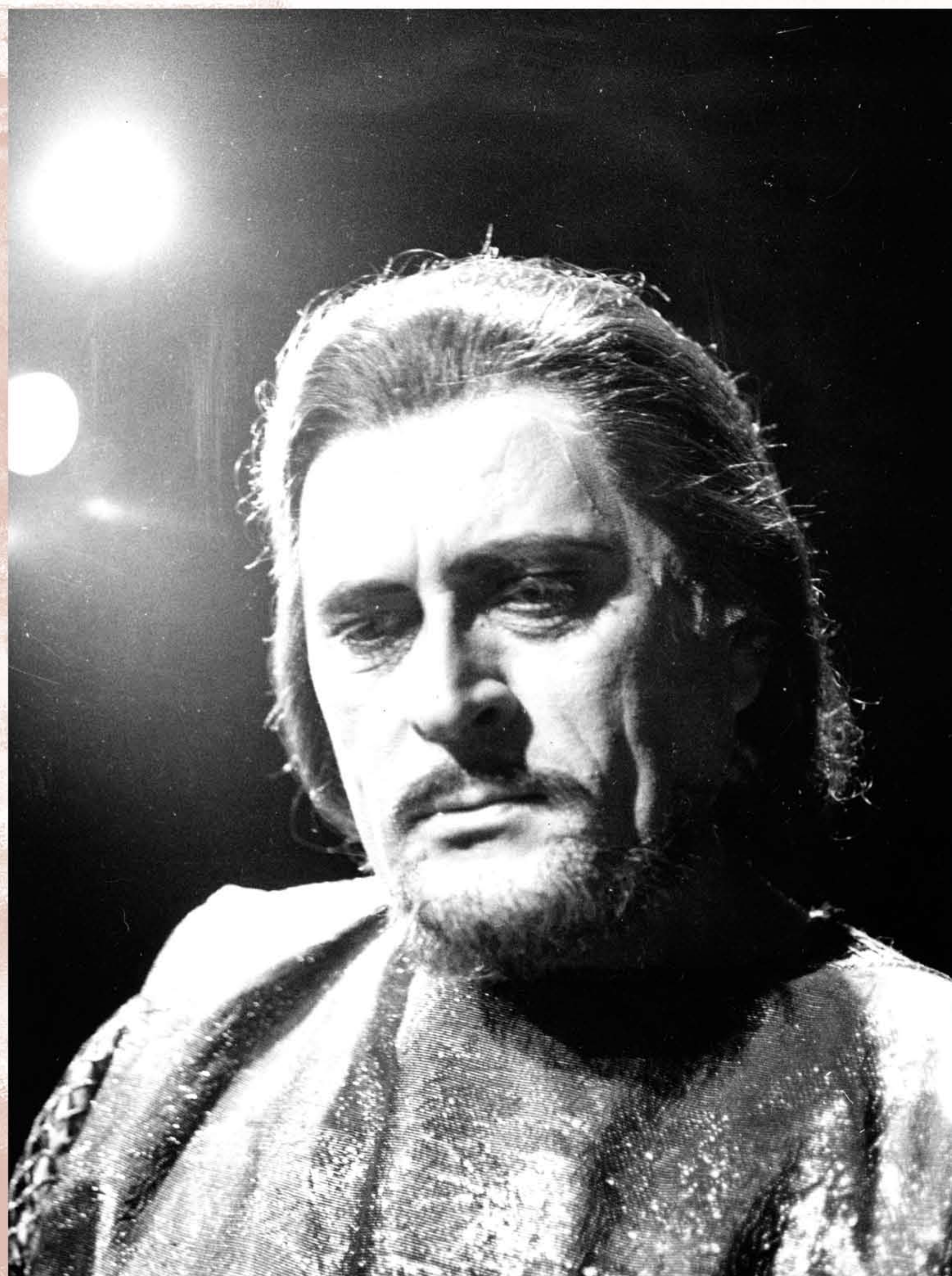
SVATOPLUK (Moyzes, Udatný kráľ, 1967)