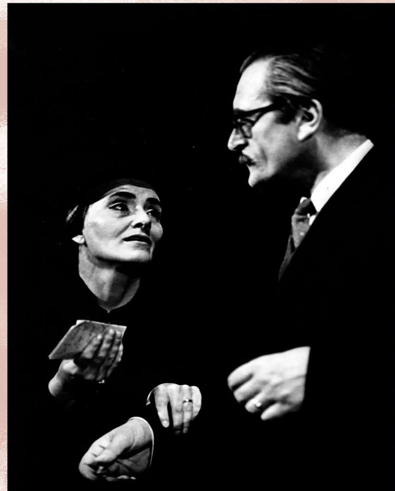
MANŽELIA GOBINEAUOVCI (Menotti, Médium, 1976)