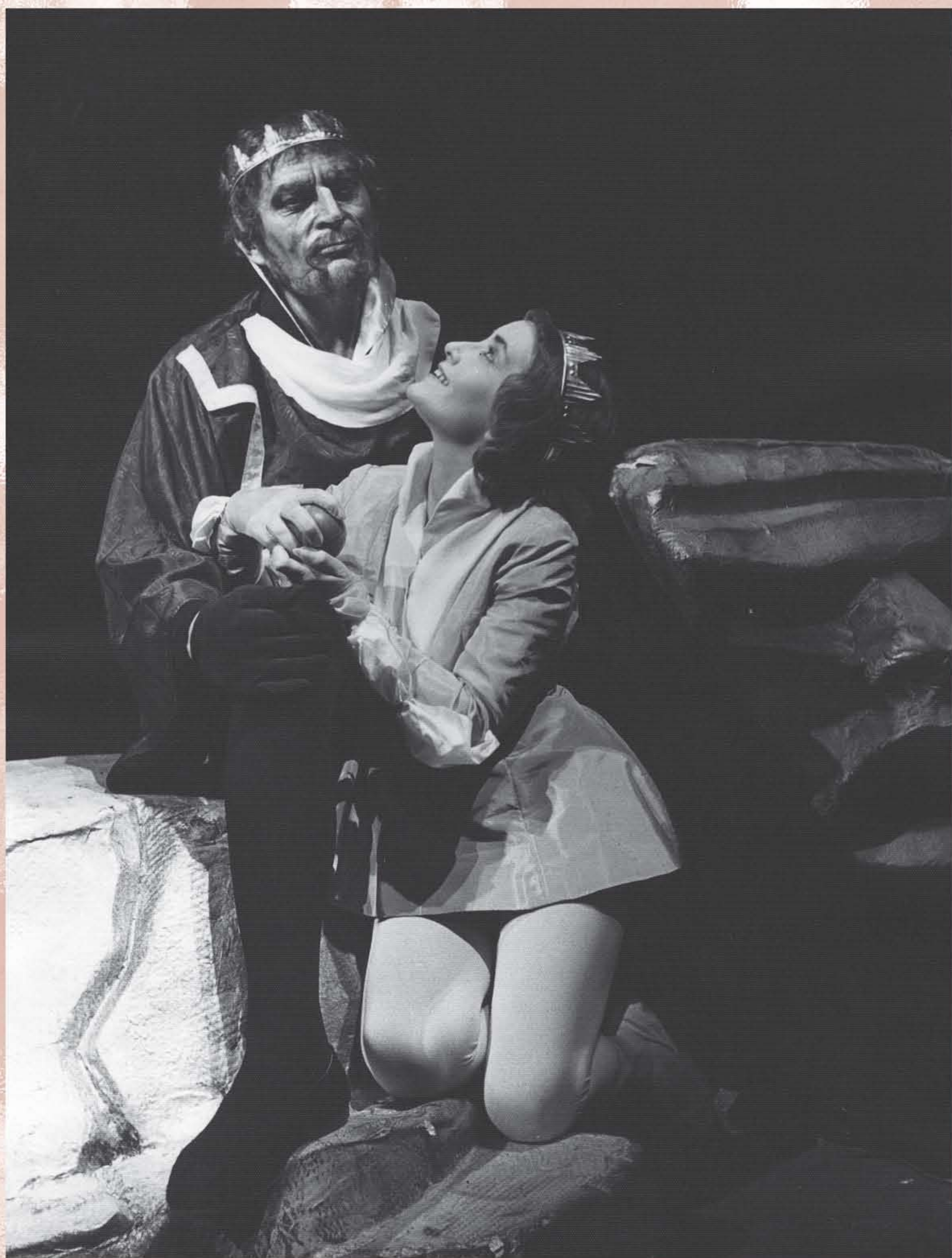
GOLAUD a YNIOLD (Debussy, Pelléas a Mélisanda, 1958)