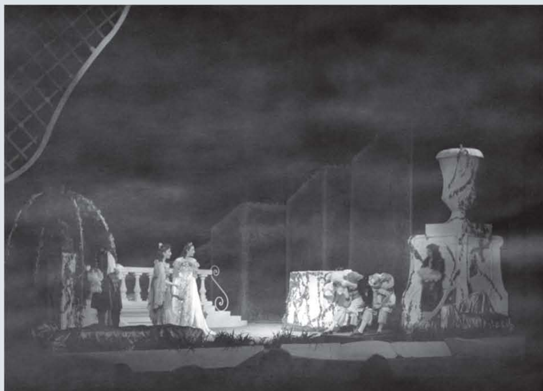
J. B. P. Molière: Mizantrop , 5. 6. 1940 Záber z inscenácie