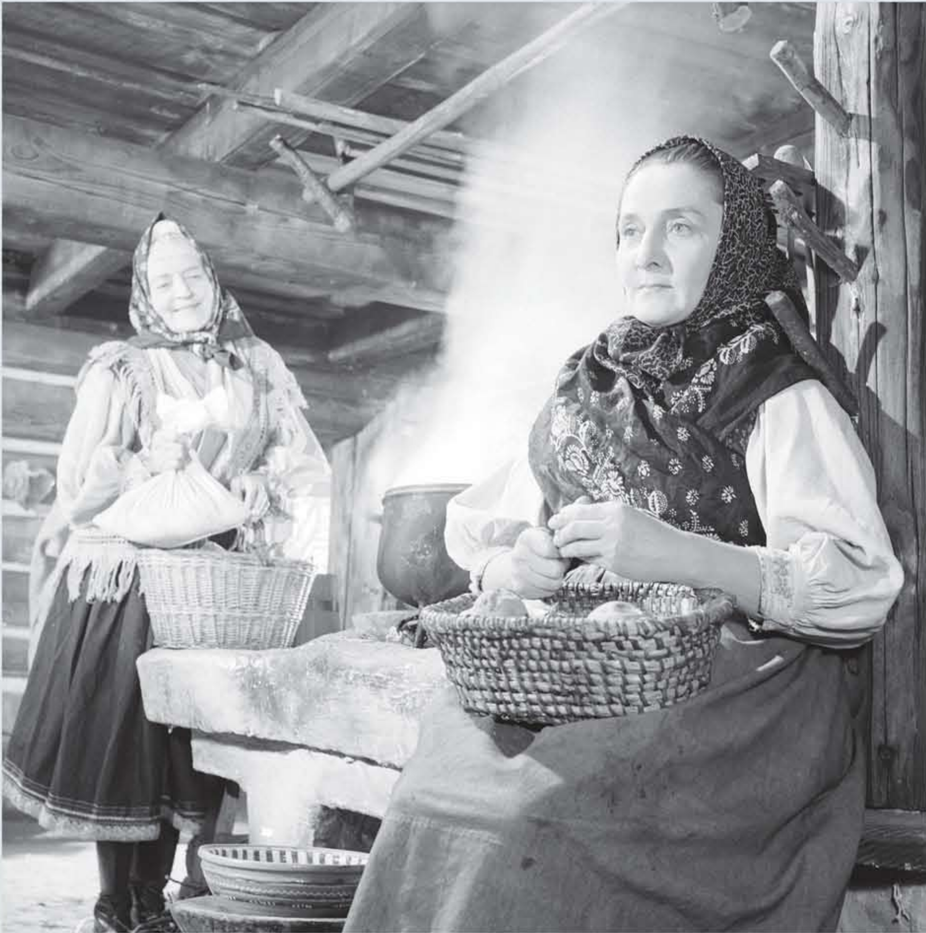
Jerguš Lapin , 1960 réžia Jozef Medved Hana Meličková, Mária Bancíková