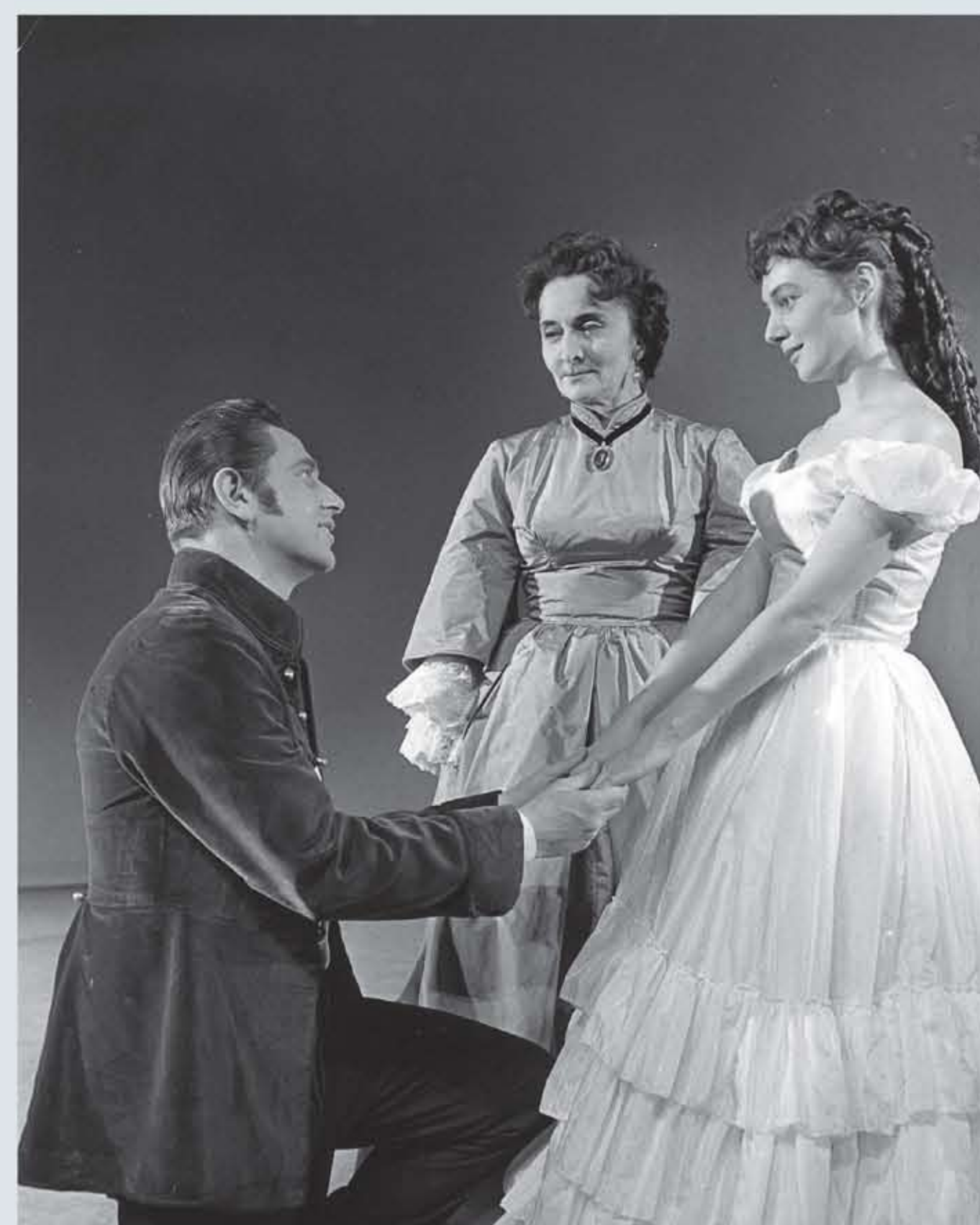
J. Palárik: Inkognito, 11. 7. 1959 réžia Karol L. Zachar Karol Machata ( Jelenský ), Mária Bancíková ( Sokolová ), Zdena Gruberová ( Evička )